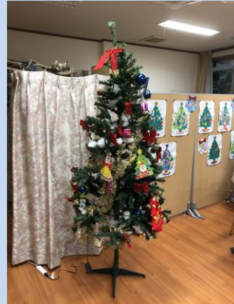
クリスマスツリーの飾りをされている様子