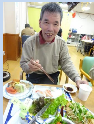
食事をされている様子