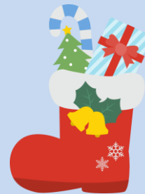
サンタクロースよりプレゼントを貰いご満悦